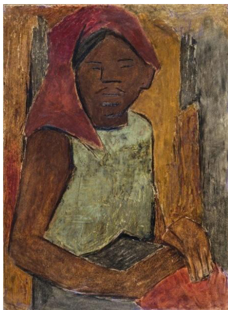
Imagen N° 5. Cecilia Marcovich 86 , Sin título (1939) 87