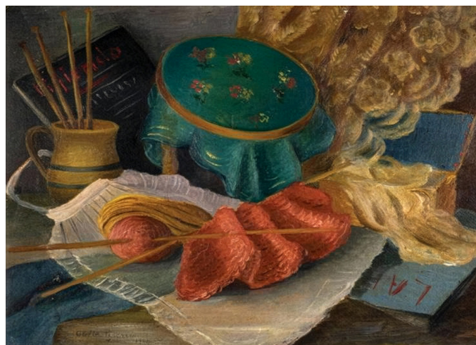
Imagen N° 2. Clelia Pissarro 17 , Labores, 1940 18