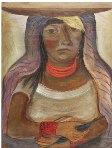
Imagen N°4. Gertrudis Chale 46 , India con collar (s.f.) 47